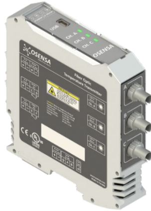
FTX-300-LUX+HG Transmetteur de Température